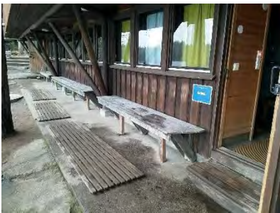
Miesten puolen sisäänkäynti

Löylyhuoneen oven vapaa kulkuaukko on 70 cm. Lauteet sijaitsevat löylyhuoneen kolmella seinällä ja kiuas on sijoitettu keskelle. Lauteissa ei ole kaiteita. Alin nousu lauteille on 37 cm, seuraava nousu 31 cm. Istuinlaudan leveys on 81 cm.