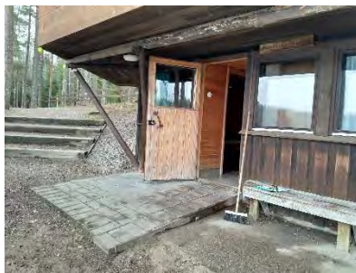
Naisten puolen sisäänkäynti